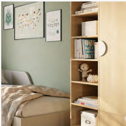
Szafa 2-drzwiowa VOX Creative