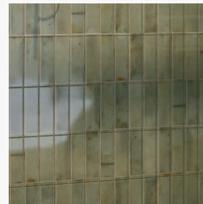
Płytki ścienne, matowe - zielona cegiełka; Argile Khaki 6x24,6