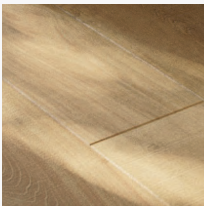
Panel podłogowy Kronostep SPC Derby R128