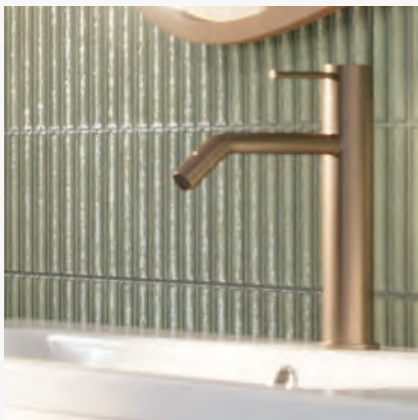
Armatura marki Deante Silia